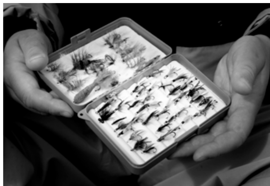
Små dobbeltkroker er melodien under septem berfisket etter sjørret i Altaelva. Klassikere som March Brown og Olsen fungerer fortsatt ...