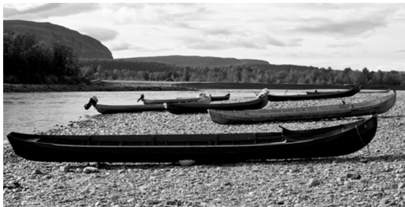
Under septemberfisket er det kun tillatt å fiske fra land. Båtene ved Elvestrand skal snart i vinteropplag.