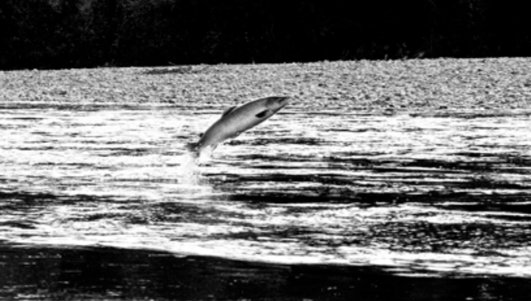
Farget fredet laks, enkelte mellom 10-15 kilo, er jevnlig oppe og markerer hvem som er den egentlige sjefen i hølen.

” Det er atmosfæren og fiskegleden langs en elv kledd i høstdrakt både til lands og til vanns som betyr noe.